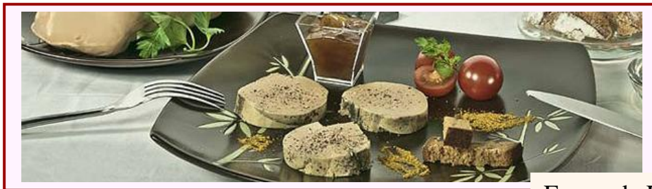
Ferme de Lafitte

Pré inscriptions pour l'Aubrac ou la journée Truffes (voir descriptif ci-après) le vendredi 28 juin de 10h30 à 11h30 au local Santamaria ou auprès d'Anne-Claire.